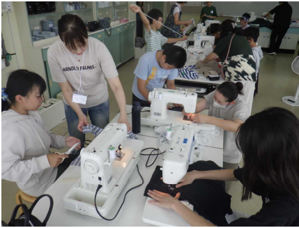
<ナップザック作り>

6年生が家庭科の時間に、修学旅行に持っていくナップザック製作をしました。このナップザックはいらなくなったTシャツなどを材料にして作ります。ミシンの扱いに慣れていない子供たちでしたが「ミシンボランティア」の方々に手伝っていただきながら、集中してミシンを操作し完成させることができました。9月1日(日)、2日(月)、1点物のナップザックを持って修学旅行に行ってきました。